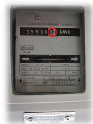
Μετρητής Γ1 (Ενιαία Μέτρηση)